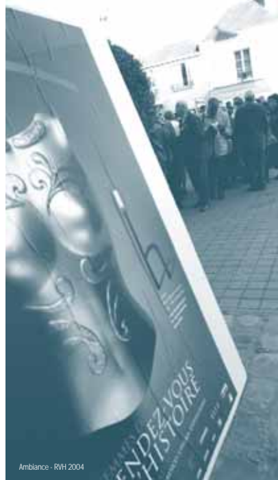
Ambiances - RVH 2004

> De 19h à 20h - Maison de la Magie GONZAGUE SAINT BRIS, écrivain