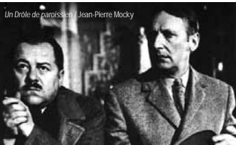
Un Drôle de paroissien / Jean-Pierre Mocky

> Dimanche 16 octobre à 14h - Cinéma Les Lobis