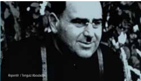
Repentir / Tenguliz Abouladze

Yasmin est une jeune pakistanaise vivant dans le nord de l'Angleterre, et essayant de concilier son respect des traditions musulmanes et son intégration à la vie occidentale. Après 11 septembre remet en question ce fragile équilibre... Un film, qui pointe les difficultés d'être musulman aujourd'hui en Angleterre, mais aussi les fractures religieuses au sein de la communauté. > Jeudi 13 octobre à 18h - Dimanche 16 octobre à 14h - Mardi 18 octobre à 14h - Cinéma Les Lobis