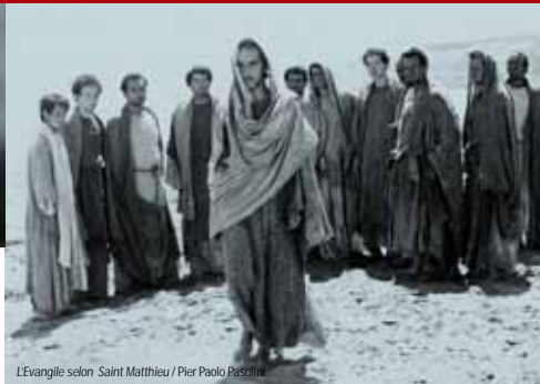
L'Evangile selon Saint Matthieu / Pier Paolo Pasolini