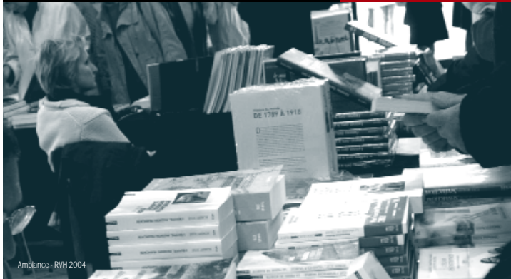
Ambiance - R/H 2004