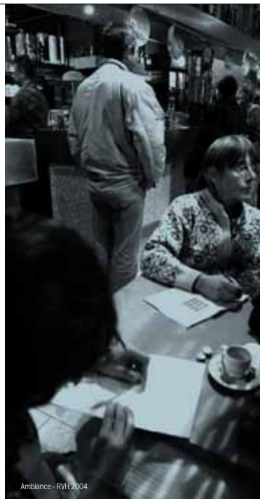
Ambiance