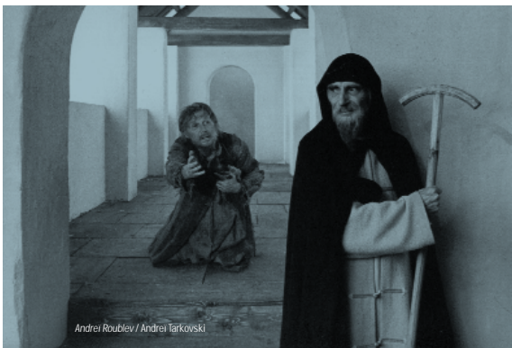
Andrei Roublev / Andrei Tarkovski