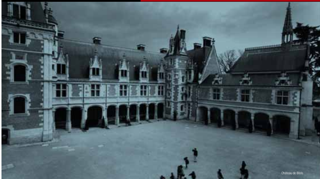
Château de Blois