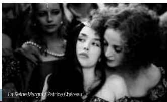
La Reine Margot / Patrice Chéreau