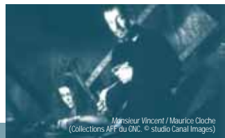
Monsieur Vincent / Maurice Cloche