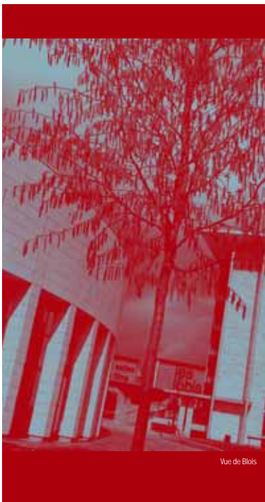
Vue de Blois