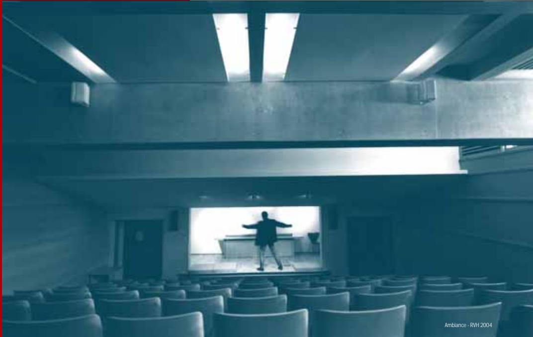
Ambiance - RWI 2004