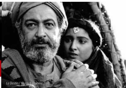
Le Destin / Youssef Chahine