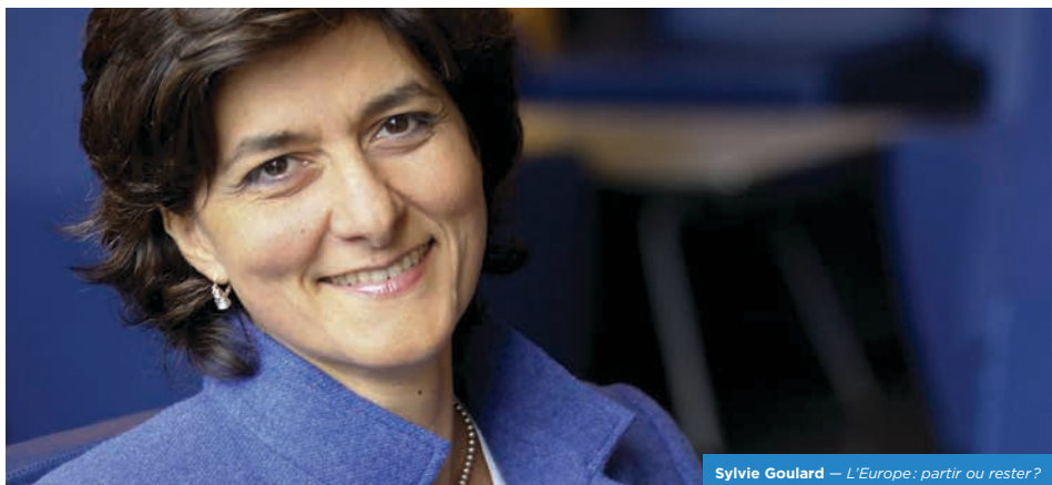
Sylvie Goulard — L'Europe: partir ou rester?