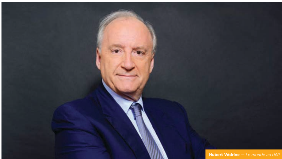
Hubert Védrine – Le monde au défi