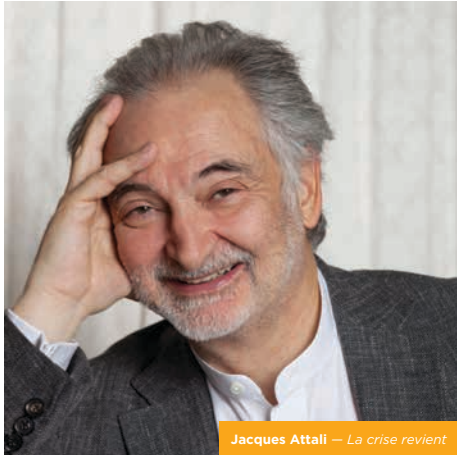
Jacques Attali – La crise revient