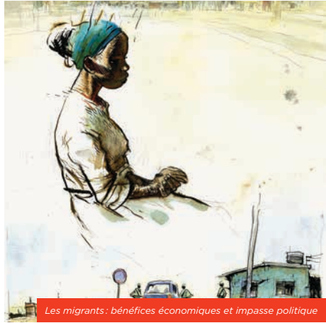
Les migrants : bénéfiques économiques et impasse politique