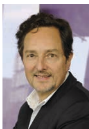
Brice Couturier