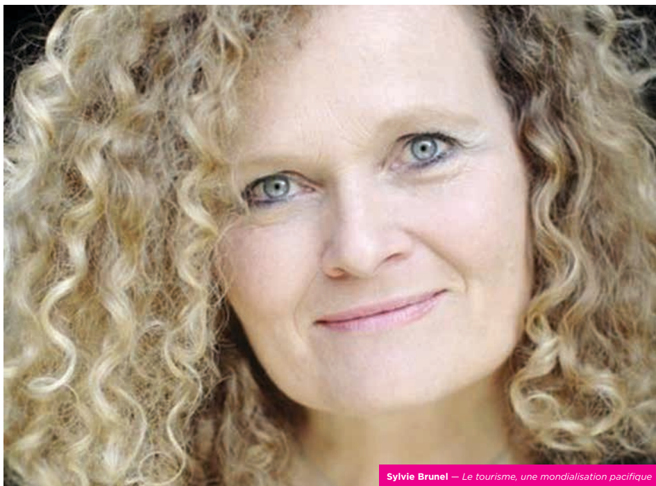
Sylvie Brunel — Le tourisme, une mondialisation pacifique