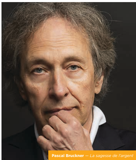
Pascal Bruckner – La sagesse de l'argent