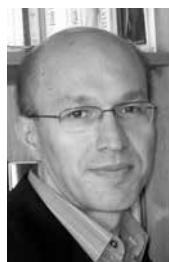
Christian Chavagneux