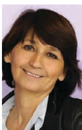
Dominique Rousset