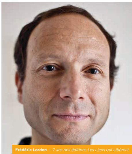
Frédéric Lordon – 7 ans des éditions Les Liens qui Libèrent