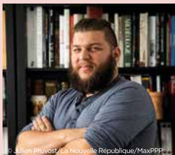
BENJAMIN BRILLAUD / NOTA BENE

NAPLES, L'INDULGENTE PROTECTION DE LA FAIBLESSE ET DES MORTS