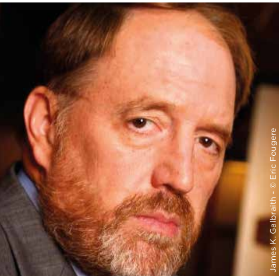
James K. Galbraith