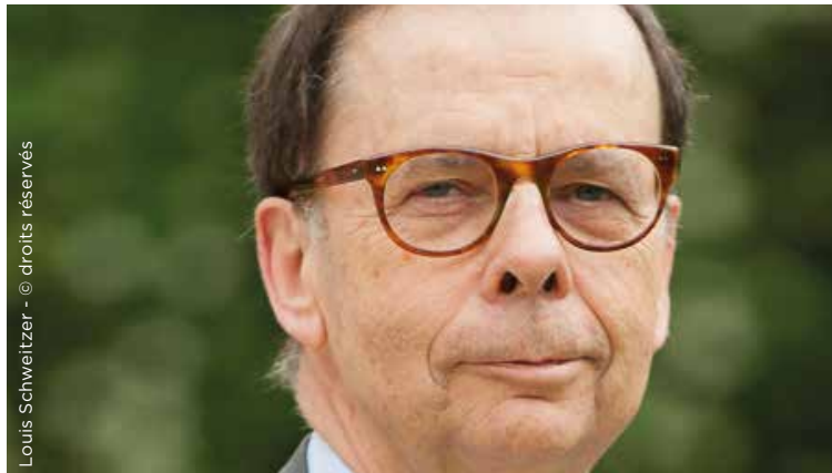
Louis Schweitzer