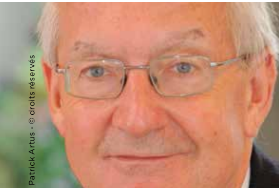
Patrick Artus