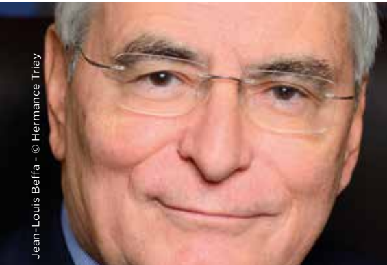
Jean-Louis Beffa

> 15H - 16H - SALLE DES ÉTATS GÉNÉRAUX, CHÂTEAU ROYAL DE BLOIS