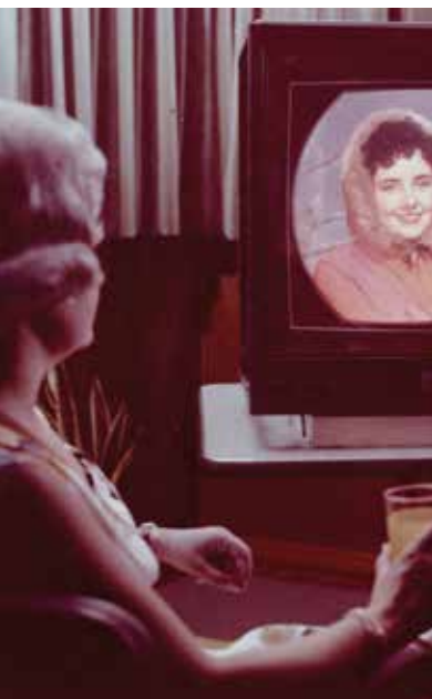
La télévision passe à la couleur, 1963.