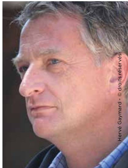
Hervé Gaymard

Entretien avec Vincent GIRET , journaliste, rédacteur en chef du journal Le Monde .