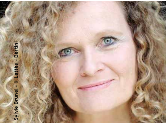
Sylvie Brunel