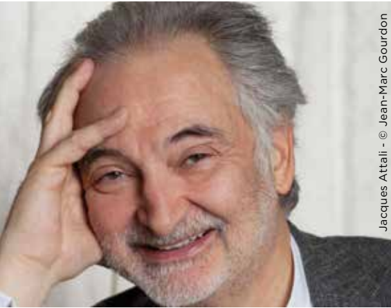
Jacques Attali

> 16H - 17H - SALLE DES ÉTATS GÉNÉRAUX, CHÂTEAU ROYAL DE BLOIS