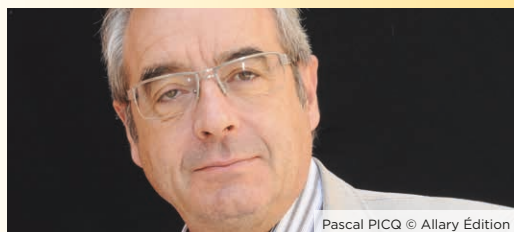
Pascal PICQ © Allary Édition