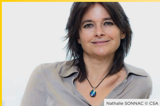
Nathalie SONNAC