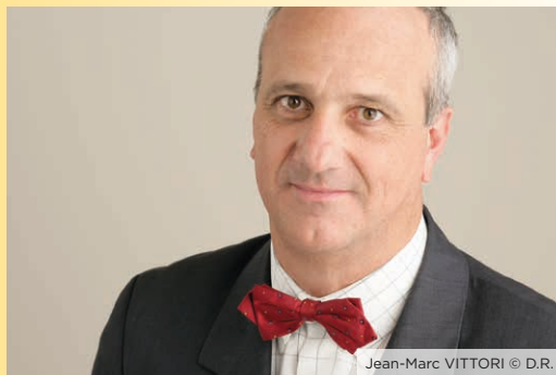
Jean-Marc VITTORI