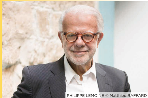
PHILIPPE LEMOINE