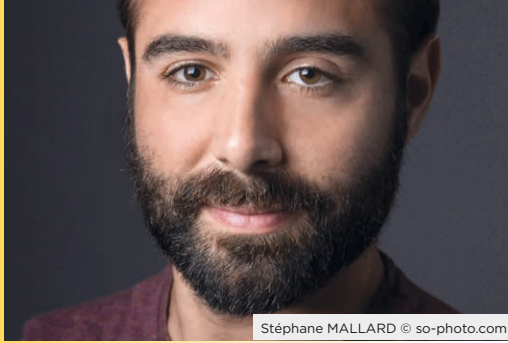
Stéphane MALLARD © so-photo.com