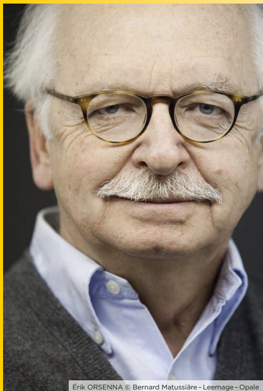
Érik ORSENNA